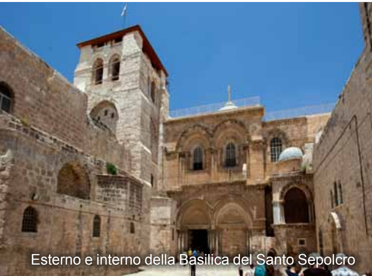
Esterno e interno della Basilica del Santo Sepolcro