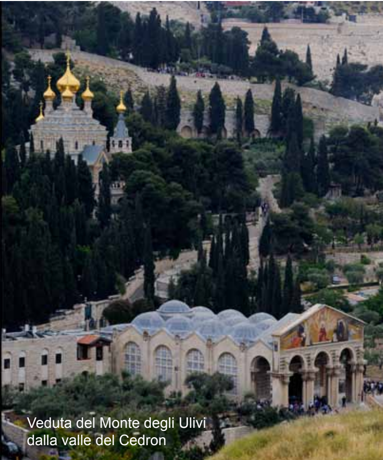
Veduta del Monte degli Ulivi dalla valle del Cedron