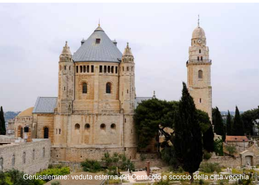
Gerusalemme: veduta esterna del Cenacolo e scorcio della città vecchia

Piccola colazione in hotel e trasferimento all'aeroporto di Tel Aviv e partenza per l'Italia.