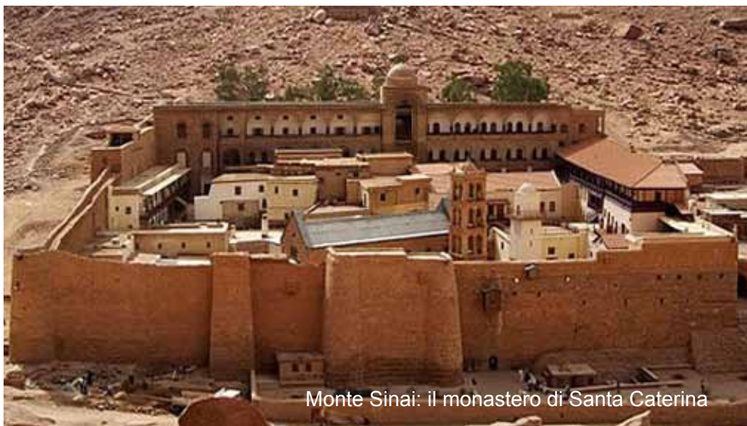
Monte Sinai: il monastero di Santa Caterina

Colazione in hotel e trasferimento all'aeroporto di Tel Aviv e partenza per l'Italia.