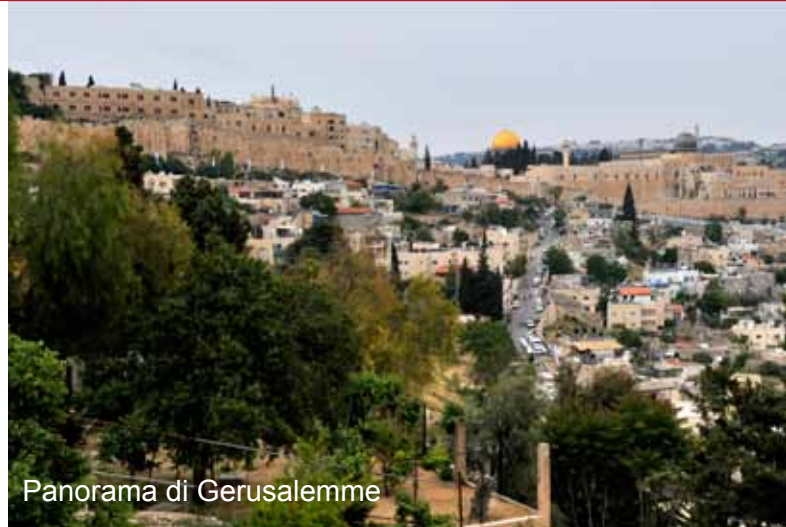
Panorama di Gerusalemme

Visita di Betlemme: il Campo dei Pastori, la Basilica della Natività. Nel pomeriggio: visita ad Ain Karem – visita panoramica della città. Rientro in hotel a Betlemme o Gerusalemme e pernottamento.