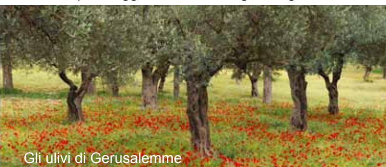
Gli ulivi di Gerusalemme

Prima colazione in hotel. Partenza per l'aeroporto e sosta a Ain Karem, luogo che ricorda l'incontro di Maria con Elisabetta e Zaccaria, genitori di Giovanni Battista (cf. Lc 1,39-56). S. Messa. Proseguimento per l'aeroporto in tempo utile per l'imbarco sul volo per l'Italia.