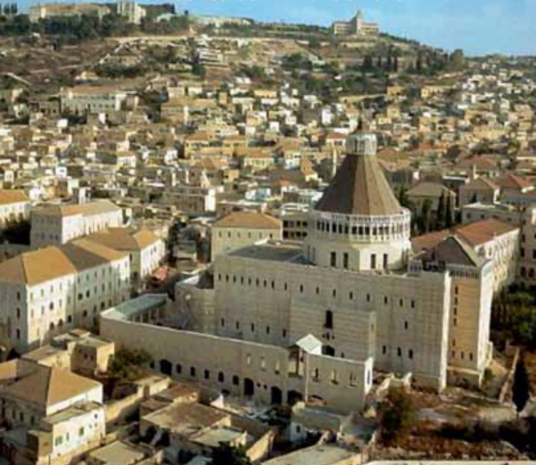
Nazareth: la Basilica dell’Annunciazione

Partenza per Tel Aviv. Rientro in Italia.