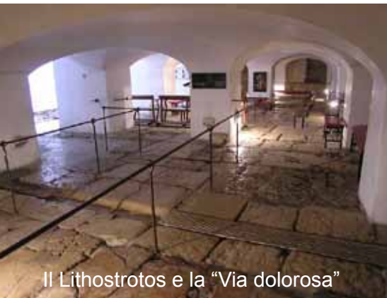
Il Lithostrotos e la "Via dolorosa"