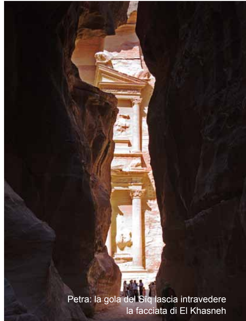
Petra: la gola del Siq lascia intravedere la facciata di El Khasneh

Prima colazione. Tempo a disposizione, trasferimento in aeroporto per la partenza per l'Italia.