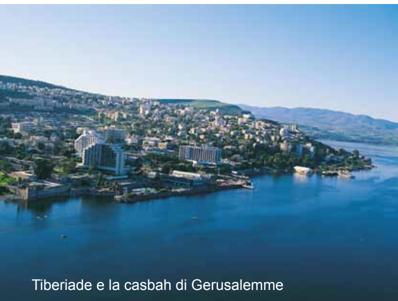
Tiberiade e la casbah di Gerusalemme

Colazione in hotel e trasferimento all'aeroporto di Tel Aviv e partenza per l'Italia.